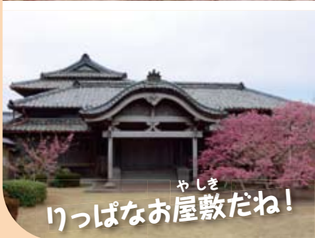
やしき 1っばなお屋敷だね!