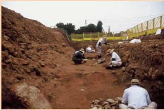
さんじょうじょうあと ほり はくつ ようす 三城城跡(さんじょうじょうあと)の堀(ほり)を発掘(はくつ)している様子(ようす)

このお話(はなし)の舞(ま)台(たい)とな(な)った三城城跡(さんじょうじょうあと)は発掘調査(はくつちようさ)が行(おこな)われ、 ちゅうせい たても はしら あと ほり あと とるい み 中世(ちゅうせい)の建(た)物の柱(はしら)の跡(あと)、堀(ほり)の跡(あと)、土(ど)塁(るい)など(など)が見(み)つかっています。 また、中世(ちゅうせい)の土(ち)器(ぎ)や滑(か)石(せき)で作(つく)った石鍋(いしなべ)、中国(ちゆうごく)や朝鮮半島(ちようせんはんとう)か ら輸(ゆ)入(にゅう)した陶磁器(とうじき)など(など)た(た)くさん(さん)の遺物(いぶつ)も発見(はつけん)されています。 ちゅうせい はんえい しろ 中世(ちゅうせい)に繁(はん)栄(えい)したお城(しろ)であ(あ)ったから(から)こそ、白(しろ)キツネ(キツネ)のよう(よう)な 話(はなし)が伝(つた)えられ、人々(ひとびと)に親(お)しま(しま)れた(れた)の(の)か(か)もし(もし)れ(れ)ま(ま)せん(せん)ね(ね)！ ※中世(ちゅうせい)…鎌倉(かまくら)～戦国時代(せんごくじだい)(今(いま)から約(やく)800～400年前(ねんまえ))の(の)こと(こと)だよ(だよ)！