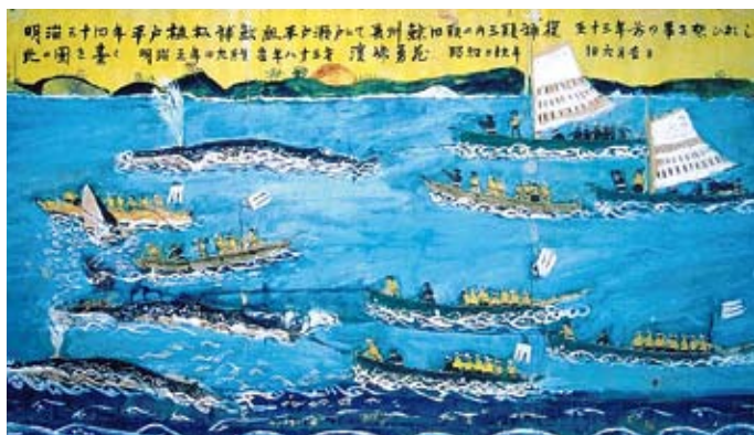
銃殺捕鯨絵馬

はたして、「つぐめのはな遺跡」の縄文人たちは、石鈿を片手に勇壮に鯨に立ち向かっていたのでしょうか？