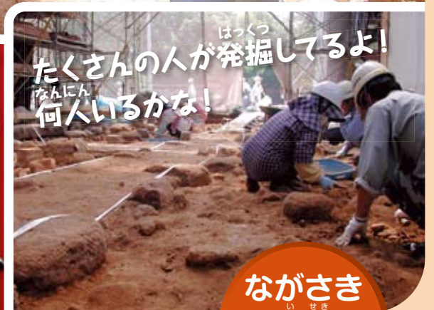
はっくつ たくさんの方が発掘してるよ! なんにん 何人いるかな!