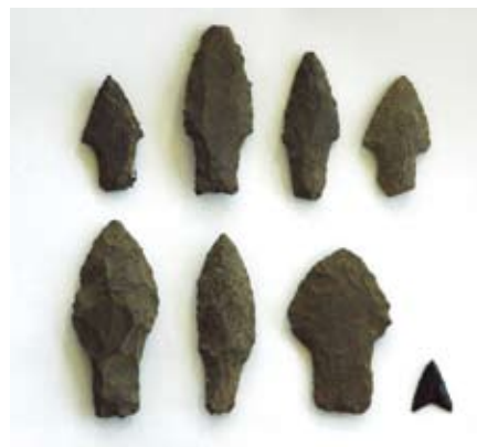
つぐめのはな遺跡出土の石鈿・石鏃

この平戸瀬戸は最狭部で幅500メートル、水深20～30メートル程の水道が3kmほど続く海峡です。春になると北の海に帰る鯨(上り鯨)が通るルートになっていて、江戸時代から昭和時代にかけて捕鯨業で栄えたところです。捕鯨業は「勇魚(=鯨)漁」とも呼ばれました。