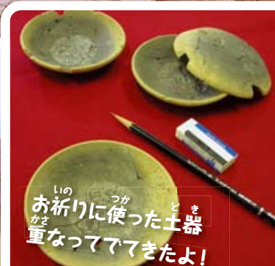
いの お祈りに使った土器 かさ 重なってでてきたよ!